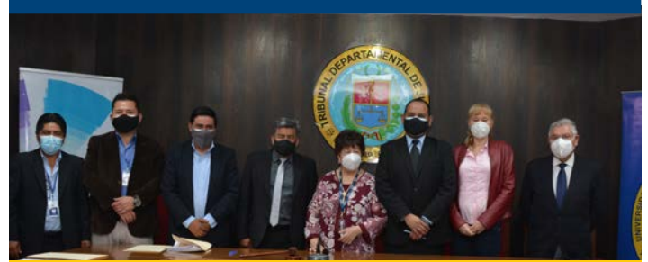
Autoridades del Órgano Judicial y de la UCB en el Salón Rojo del Palacio de Justicia.

Cabrera añadió que esta firma ayudará a reducir los temas pendientes con relación al área de Derechos Reales, con la intención que los estudiantes ayuden a reconducir todos estos temas pendientes. Por su parte, el Presidente del Tribunal de Justicia admitió que "los pasantes eventualmente se constituyen en un elemento con un valor humano muy importante para prestar el