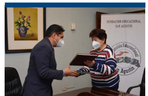
La Rectora de la UCB y el Presidente de FESA intercambian las carpetas, sellando la alianza educativa.

Estamos seguros que muy pronto les estaremos compartiendo las primeras actividades fruto de esta trascendental alianza interinstitucional.