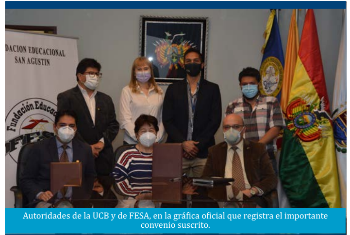
Autoridades de la UCB y de FESA, en la gráfica oficial que registra el importante convenio suscrito.

Por su parte, la Rectora de la UCB expresó, visiblemente emocionada, “es una gran alegría que estemos en este momento. (...) estaba recordando todo lo que conozco sobre la historia de esta zona. El año ‘61 vine a estudiar a la residencia de las Teresianas, que está en frente, y los dos únicos edificios que había eran la residencia que estaba en construcción, el primer bloque del colegio