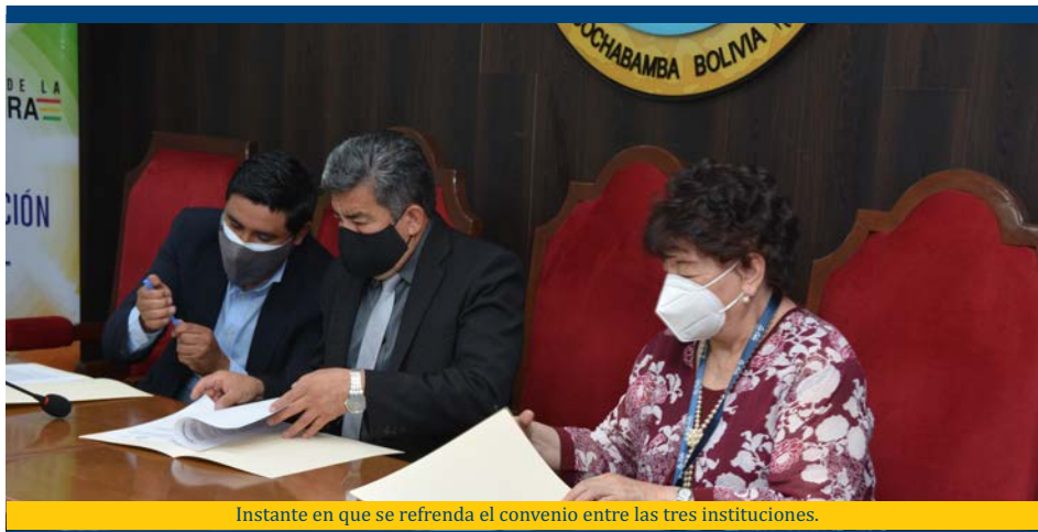
Instante en que se refrenda el convenio entre las tres instituciones.

judiciales y la UCB, posibilitando que se pueda de integrar y contribuir a la formación teórica y práctica de los estudiantes, promocionar espacios que generen prácticas sobre los conocimientos adquiridos y desarrollar espacio de sensibilización para la formación.