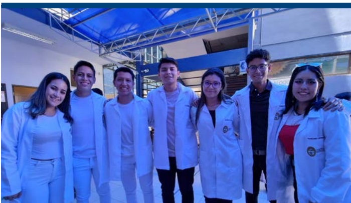
Grupo de estudiantes de Medicina. La primera promoción será inolvidable, expresaron.