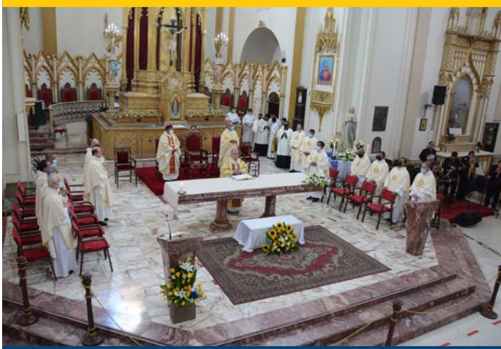
Obispos y sacerdotes que celebraron la Eucaristía.