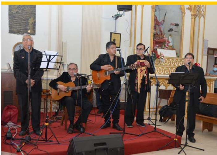
Grupo Aysana deleitó en el ministerio de música.