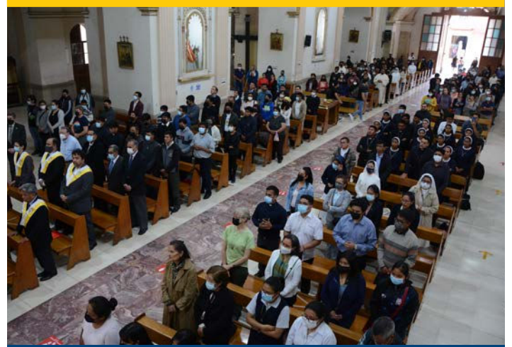
Plano general del público que asistió a La Catedral.