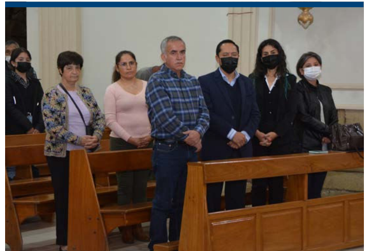
Personal administrativo en primera fila.