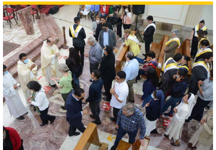
Conmovedora participación durante la Comunión.