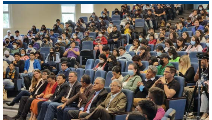
Auditorio Principal colmado de nuevos estudiantes. En las primeras filas, los Directores de las Carreras.