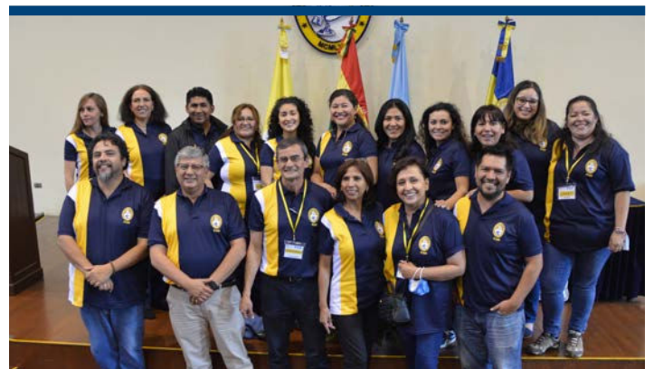
Docentes de la PAM: comprometidos con el amor y el servicio.