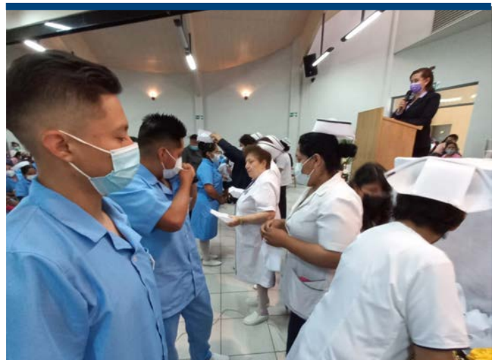
La imposición de la cofias, de parte de las docentes a los estudiantes.

El evento concluyó con la presentación de estampas del folklore boliviano, a cargo de estudiantes de los distintos semestres de la Facultad.