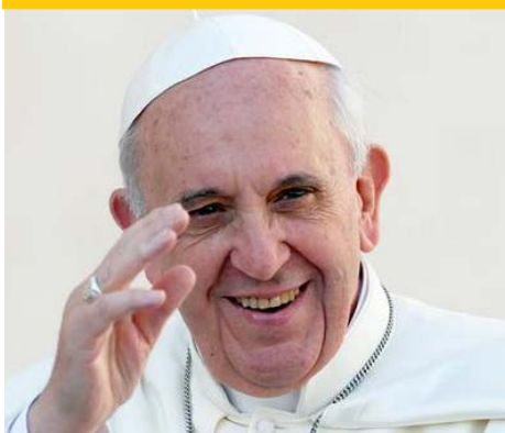
El Sumo Pontífice, Papa Francisco.