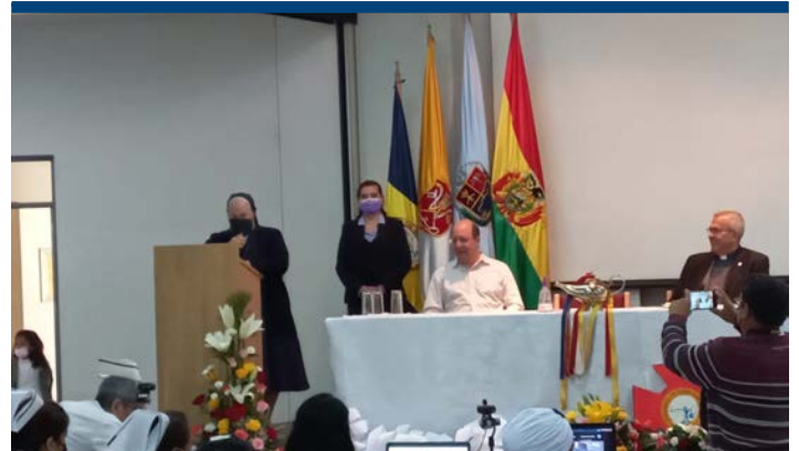
La Decana de la Facultad destaca el rol del personal en salud comprometido.

A su turno, la Decana de la Facultad expresó su satisfacción señalando que "nuestra alegría casi permanente es encontrarnos con ex alumnas que nos confirman que la formación no ha sido en vano". Destacó que "docentes durante varias generaciones se comprometieron con la tarea de formar profesionales que ofrecen un servicio de calidad y calidez humana. Por ello, se continuará en la tarea de formar en excelencia a los enfermeros, pero fundamentalmente al ser humano", enfatizó.