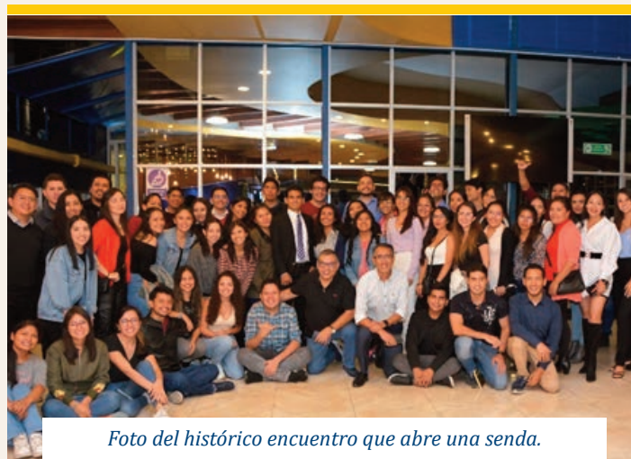
Foto del histórico encuentro que abre una senda.