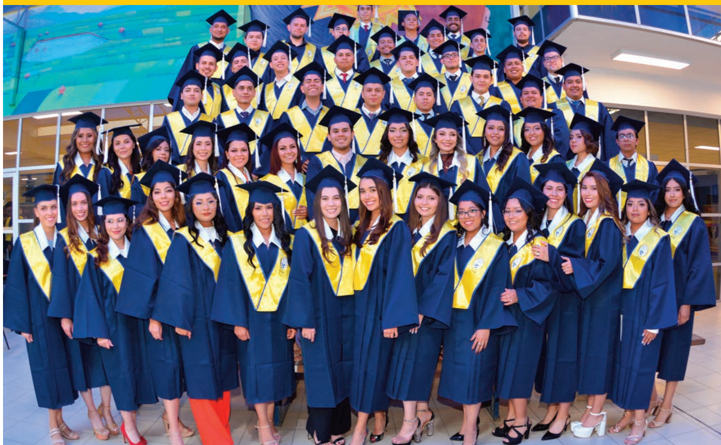
Titulados de Administración de Empresas, Contaduría Pública, Ingeniería Comercial, Ingeniería Financiera e Ingeniería Empresarial.

Y es que la vida nunca será lineal: está llena de altibajos, de fracasos y éxitos, donde lo esencial es aceptar y aprender de cada momento. Es normal sentirnos intimidados ante el nuevo camino que se nos presenta; somos humanos y es válido temer al cambio y despedirnos de una etapa que ha sido parte de nosotros durante tanto tiempo. Sin embargo, aceptar el cambio no significa olvidar todo lo vivido, sino honrar cada recuerdo. Celebremos y reconozcamos lo lejos que hemos llegado, no desaprovechemos nuestra capacidad; confiemos en nosotros mismos y valoremos el presente. Seamos honestos, amables, pacientes y respetuosos, tanto con los demás como con nosotros mismos y abracemos a cada una de nuestras facetas.