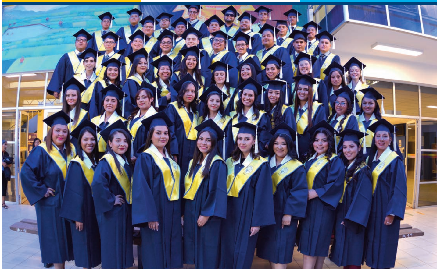
Nuevos profesionales en Enfermería, Comunicación Social, Derecho, Ingeniería de Telecomunicaciones, Psicología, Ingeniería Química, Ingeniería Financiera e Ingeniería Mecatrónica.

Por lo tanto, les insto a que sigan sus sueños, a que luchen por lo que creen, a que se atrevan a ser diferentes y a que nunca pierdan la esperanza en sí mismos.