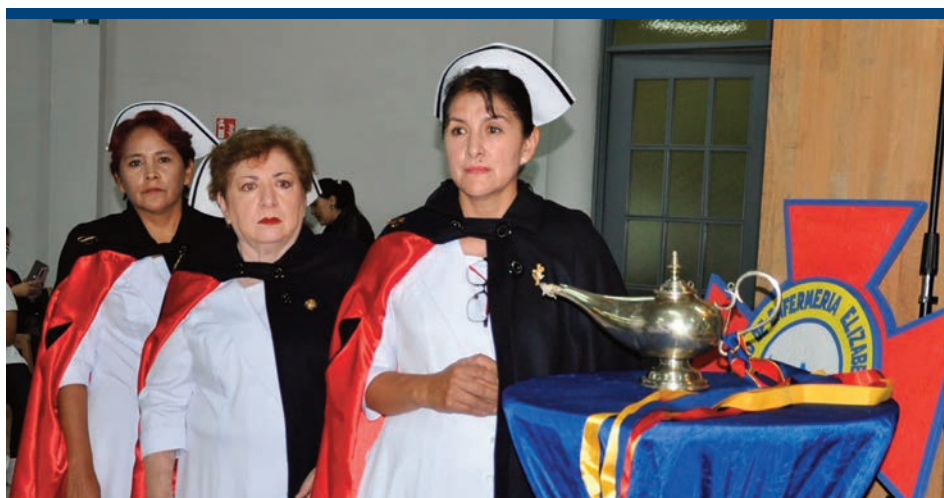
Docentes enfermeras, pilar fundamental de una formación comprometida y de excelencia.

Otras significativas plaquetas fueron entregadas con las saluciones de los rectores de Sede que nos honraron con su presencia, y posteriormente sumaron sus adhesiones la Gobernación de Cochabamba, el Comité Cívico, la Federación de Profesionales, el Colegio de Enfermeras y distintas promociones de egresadas de la Facultad.