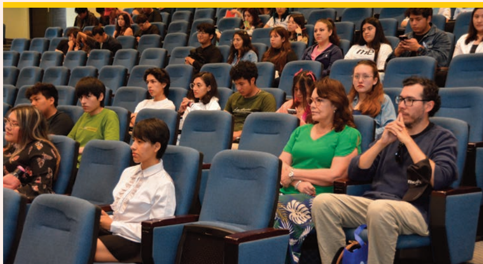
Un ángulo del auditorio constituido por estudiantes, docentes y socios estratégicos como representantes de institutos y centros de investigación, Fundaciones y ONG’s.