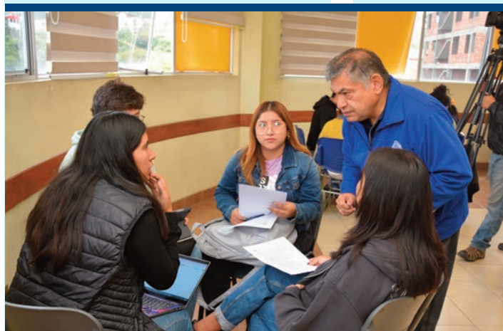
El autor de este artículo (de pie) en el asesoramiento permanente con uno de los equipos de trabajo de los universitarios.

social denominada "Hack4Change: Educando para un mundo mejor" en la que los estudiantes a partir de la identificación de problemas locales propuestos por los docentes de cada sede, los estudiantes reflexionaron y presentaron propuestas de solución alineadas a los siete ejes estratégicos del