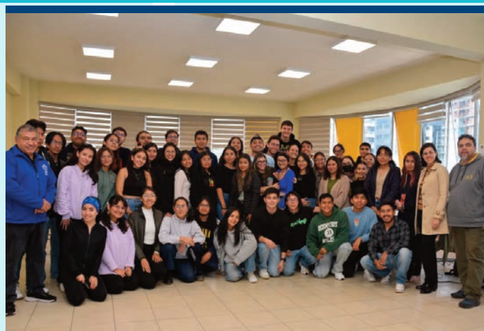
Estudiantes y docentes comprometidos voluntariamente con las líneas de reflexión y trabajo del Pacto Educativo Global.

Asimismo, asistieron en el mes de agosto de 2024 al "Seminario Internacional sobre el magisterio educativo y cultural del papa Francisco: conceptos y praxis del Pacto Educativo Global" realizado en la Universidad Javeriana (Bogotá). Posteriormente, los docentes participantes trabajaron con sus estudiantes en un ejercicio de incorporación o cualificación de los trabajos o grupos estudiantiles desde la inspiración y orientación de la perspectiva del Pacto Educativo Global. Finalmente, en este mes de marzo de 2025, los docentes participantes de las Sedes de la UCB realizaron una actividad