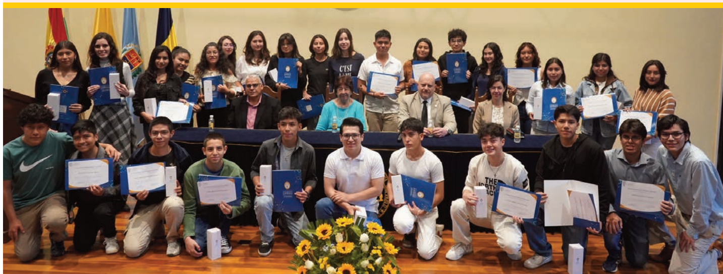
Estudiantes beneficiarios de estas atractivas becas exhiben orgullosos la certificación que acredita su excelencia, en el acto que presidieron las autoridades de la Sede.