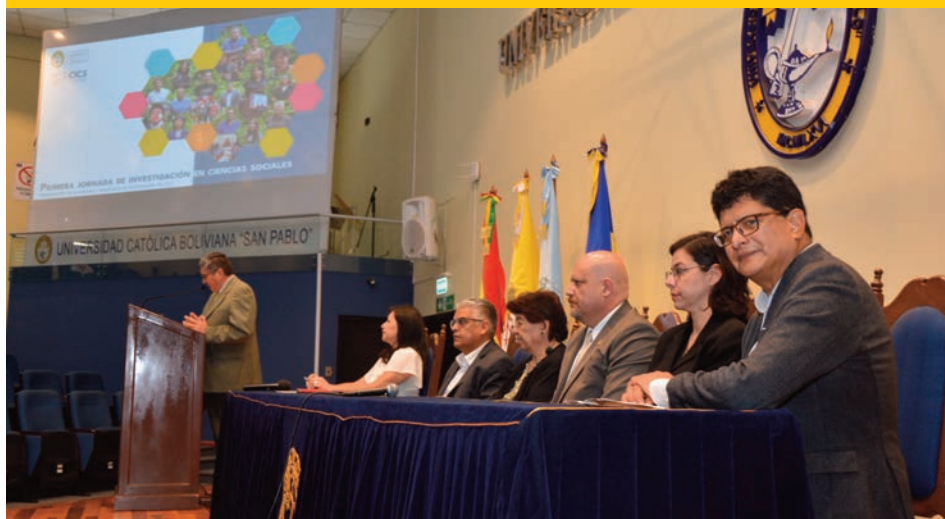
Presencia de la Rectora y las autoridades de Sede, junto a la Directora del Departamento de Ciencias Sociales y el Coordinador del Centro de Investigación del área.

El 25 de marzo se realizó la “Primera jornada de investigación en ciencias sociales”, organizado por el Centro de Investigación en Ciencias Sociales (CICS) de la Sede.