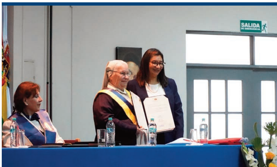
Entrega de la distinción del Senado Nacional a la Decana de la Facultad de Enfermería.