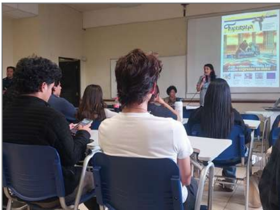
Momentos durante la presentación del periódico