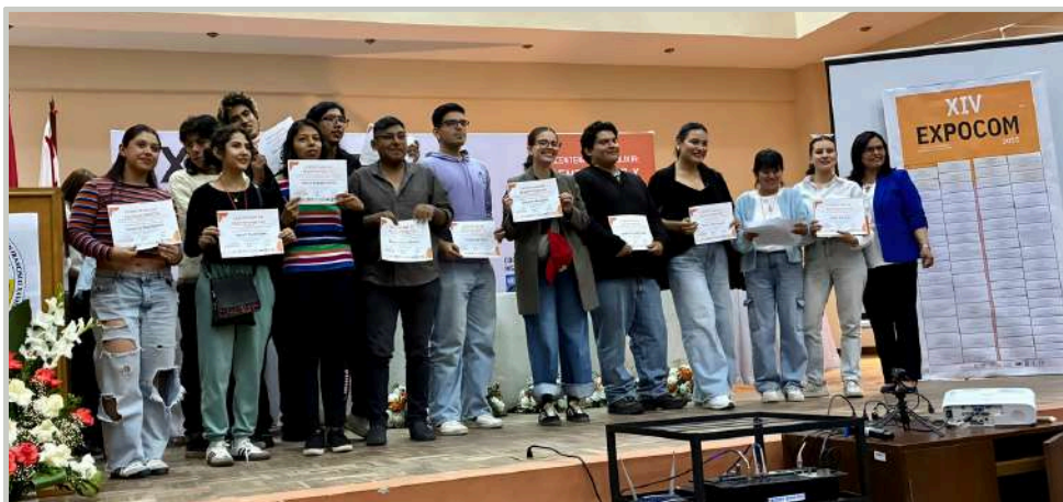
Tercer lugar para la revista Perspectiva Financiera&Empresarial en la categoría "Revista digital".

!!FELICIDADES A NUESTROS ESTUDIANTES Y DOCENTES!!