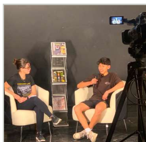
Transmisiones en vivo desde el SECRAD