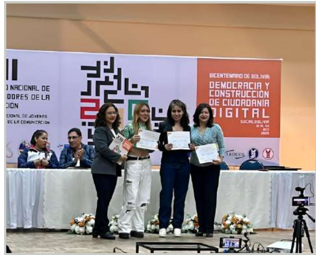
Primer lugar para el periódico Tupuraya en la categoría "Material impreso"

Participamos en las Jornadas con una delegación numerosa de estudiantes que presentaron sus investigaciones en las distintas temáticas, así como en mesas de trabajo, talleres y en EXPOCOM donde ganamos el PRIMER LUGAR en la categoría "Material Impreso" con el "Periódico Tupuraya" y TERCER LUGAR en PUBLICACIÓN DIGITAL con la Revista "Perspectiva Financiera&Empresarial". Una grata experiencia académica y de interacción con merecidos reconocimientos.