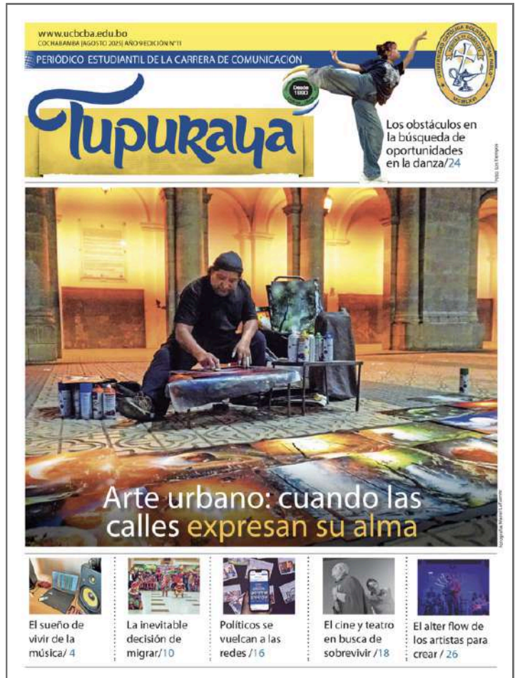
Portada de la más reciente edición

Los trabajos presentados no solo muestran la sensibilidad social desde la mirada de los jóvenes, sino también el detalle en el proceso de investigación a partir del uso de diversas fuentes, verificación de datos, contrastación y otros, para aproximarse al entorno social con una mirada rigurosa y a la vez sensible.