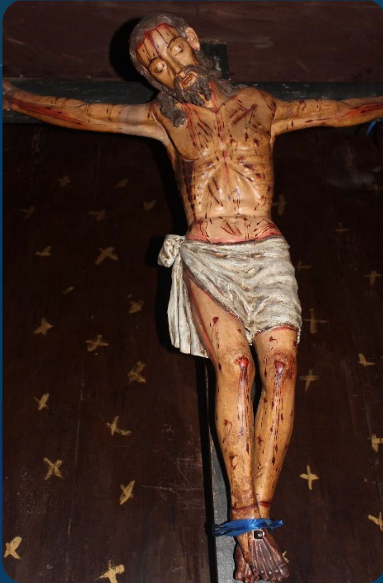
Cristo Murano – Museo parroquial de Arani

Patrimonio religioso del Valle Alto. Devoción, historia y reflexión desde la tradición.