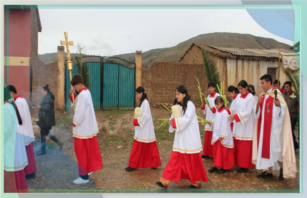
Capilla Chinguri