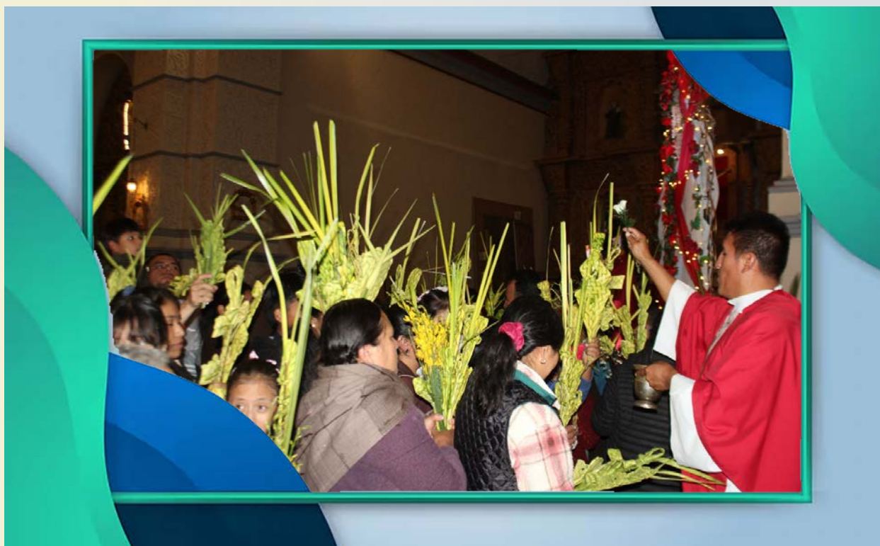
Bendición de palmas, Santuario la Bella.