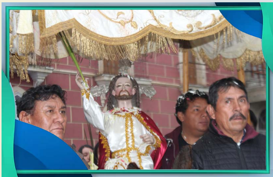
Santuario la Bella, Arani

La borrica traslada la imagen de Jesús hasta la puerta de ingreso del templo. En tono muy familiar y cariñoso los feligreses de Arani denominan al señor de Ramos como "Tata Ramitos", le acompañan con devoción y alegría; saben que la Semana Santa empieza con esta ceremonia. Pasada la procesión del Tata Ramitos, los