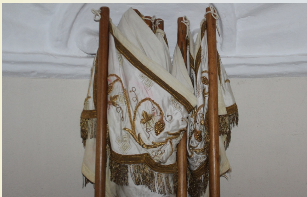
Santuario la Bella, Arani