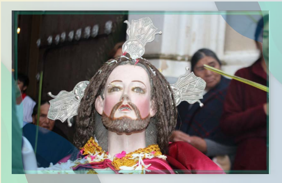
Santuario la Bella, Arani