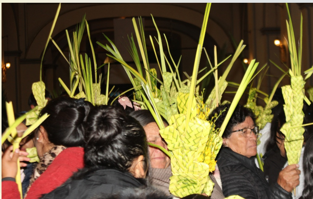
Santuario la Bella, Arani

Las palmeras benditas, agitadas durante la procesión, son llevadas a casa y guardadas cuidadosamente por su valor sacramental simbólico. Se rescata las siguientes tradiciones populares sobre las palmeras en las comunidades de Arani: