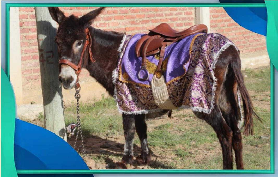
Capilla Chinguri

BORRICA CON MONTURA PARA EL SEÑOR DE RAMOS.