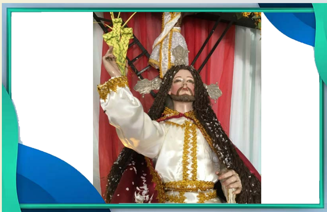
Santuario la Bella, Arani