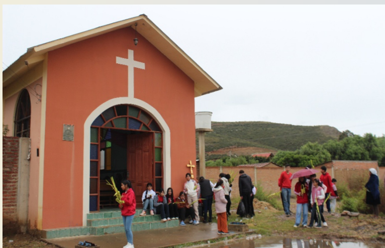
Capilla Chinguri