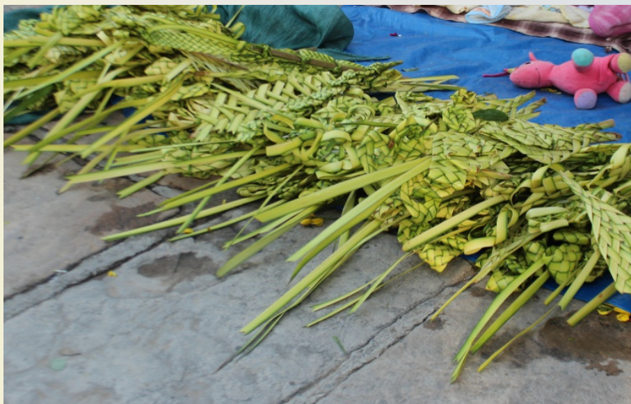
Puerta del templo de Arani

Las palmeras benditas, agitadas durante la procesión, son llevadas a casa y guardadas cuidadosamente por su valor sacramental simbólico. Se rescata las siguientes tradiciones populares sobre las palmeras en las comunidades de Arani: