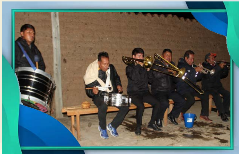
Capilla Chinguri