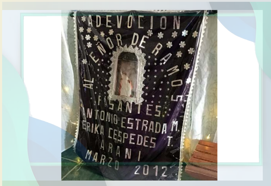
Capilla Chinguri