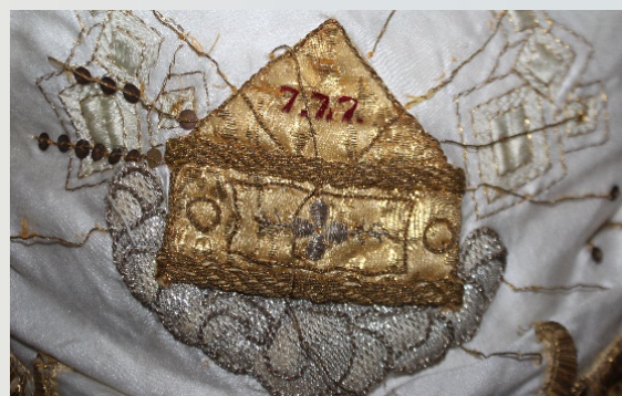
Santuario la Bella, Arani

En el Valle Alto, Arani es una de las pocas parroquias que aún conserva la tradición de realizar la entrada triunfal de Jesús a Jerusalén, montado en una borrica. Esta particularidad es notoria; una ceremonia que se luce como en épocas pasadas y conserva el mensaje de Jesús como un “Rey humilde y pacífico” porque el burro simboliza servicio, fidelidad, humildad. Jesús da cumplimiento a la profecía de Zacarías (9,9).