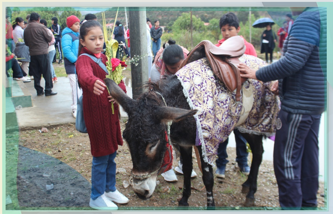
Capilla Chinguri