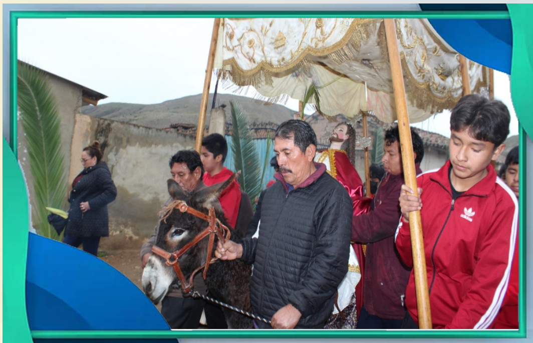
Capilla Chinguri