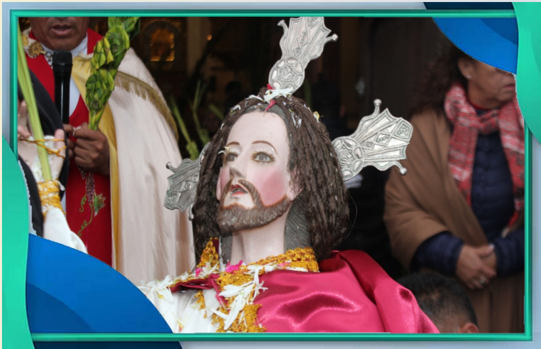
Santuario la Bella, Arani

niños degustan las manzanas endulzadas que se venden junto a la puerta del templo; hoy en día se ha incorporado la venta de huevos de chocolate y otras variedades de chocolate.