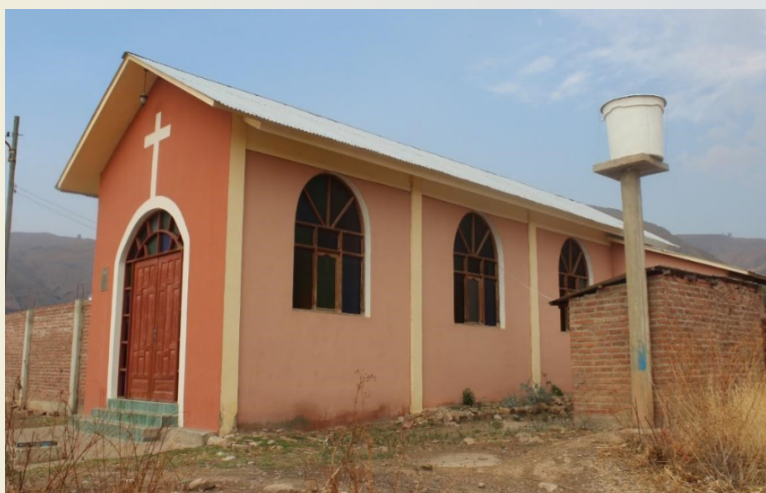
Capilla Chinguri

Esta capilla está localizada en una zona pintoresca en las faldas del cerro la “cuesta”, camino a Mizque, Aiquile y Sucre. Es una capilla nueva, construida e inaugurada en marzo de 2005, con financiamiento de la Honorable Alcaldía Municipal de Arani. Se venera una hermosa imagen que representa el crucificado, en la fiesta de santa vera cruz.