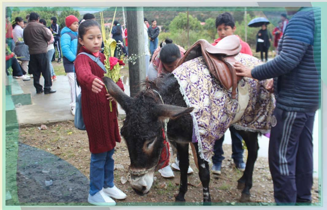
Capilla Chinguri