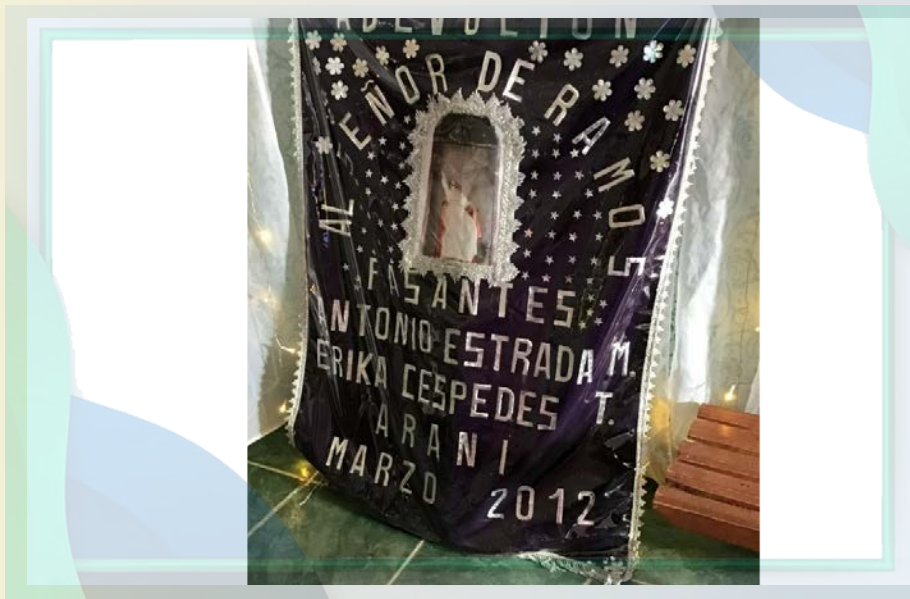
Capilla Chinguri